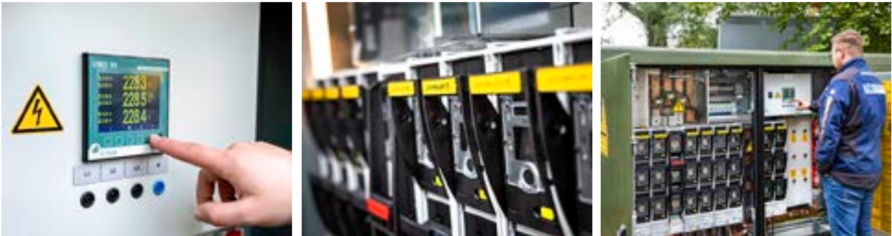
Ein Blick ins Innenleben: Das Besondere an intelligenten Trafostationen ist, dass die Daten nicht nur exakt ermittelt, sondern auch online an die TEN übermittelt werden. Das spart Zeit und macht das Netz effizienter, sicherer und steuerbarer.

Wie schon auf der vorherigen Doppelseite beschrieben, müssen wir unser Stromnetz modernisieren, um es an die neuen Herausforderungen der Energiewende anzupassen. Ein wesentlicher Punkt dabei ist, dass wir Stromflüsse sehr viel exakter kontrollieren und steuern müssen. Wie genau das geht, zeigt ein Blick in unsere intelligenten Trafostationen, die überall im Netz eingesetzt werden.