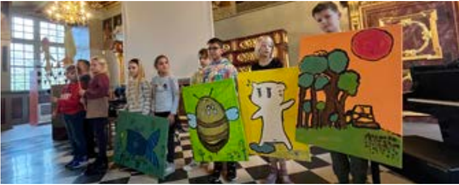
Die Ostenfelder Kinder prämiieren die Gewinner des Kinderliteraturpreis Schlossgeschichten mit viel Phantasie im Schloss Bad Iburg.