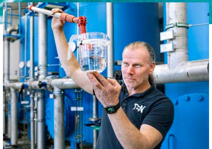
Leitungswasser ist in Deutschland eines der am besten kontrollierten Lebensmittel überhaupt. Die Trinkwasserverordnung regelt, wer für die Prüfung zuständig ist.